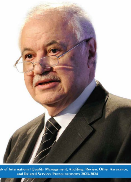
Handbook of International Quality Management, Auditing, Review, Other Assurance, and Related Services Pronouncements 2023-2024

عمان - أعلن سعادة الدكتور طلال أبوغزاله رئيس المجمع الدولي العربي للمحاسبين القانونيين IASCA عن إصدار المجمع لأحدث نسخة عربية مترجمة من المعايير الدولية لإدارة الجودة والتدقيق والمراجعة وعمليات التأكيد الأخرى والخدمات ذات العلاقة لعام 2024، بالتعاون مع الاتحاد الدولي للمحاسبين IFAC.