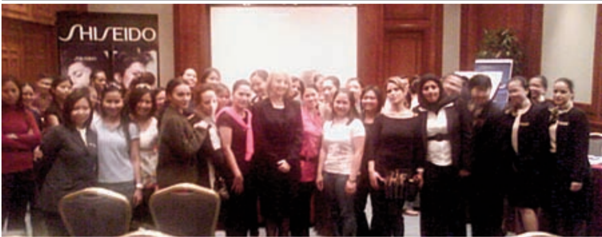
المشاركين في الدورة

اهتماماً من الإدارة التنفيذية للصورة المثالية لمجال الفندقية والضيافة قام مؤخراً فندق الخليج بالتعاون مع مجموعة الحواج بعقد عدد من دورات في مجال المكياج والابتكيت للموظفات في المكاتب الأمامية وعلاقات الضيوف ومضيفات المطاعم