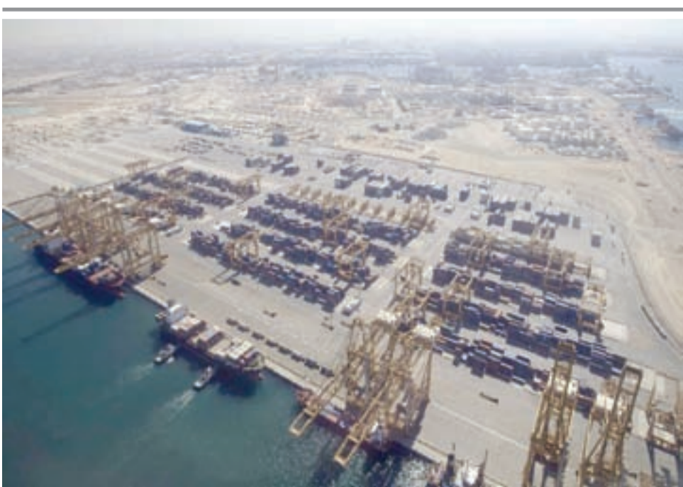
ميناء جبل علي