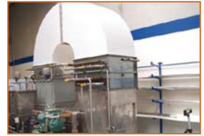
الفائز عن فئة البيئة Creative Water Technology