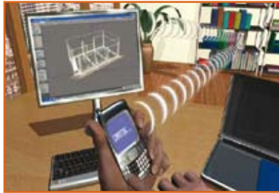
الفائز عن فئة الابتكار المتميز Gigabit Wireless Transceiver on CMOS