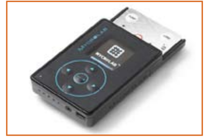
الفائز Handheld Medical Diagnostic System