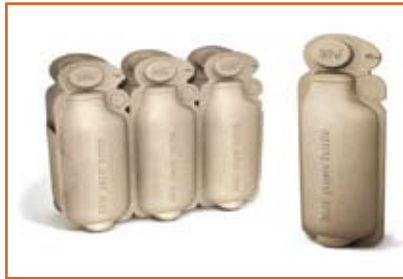
الفائز الدولي Paper Water Bottle ٣٦٠