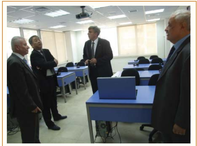
السفير الصيني في جولة داخل مبنى الاكاديميات