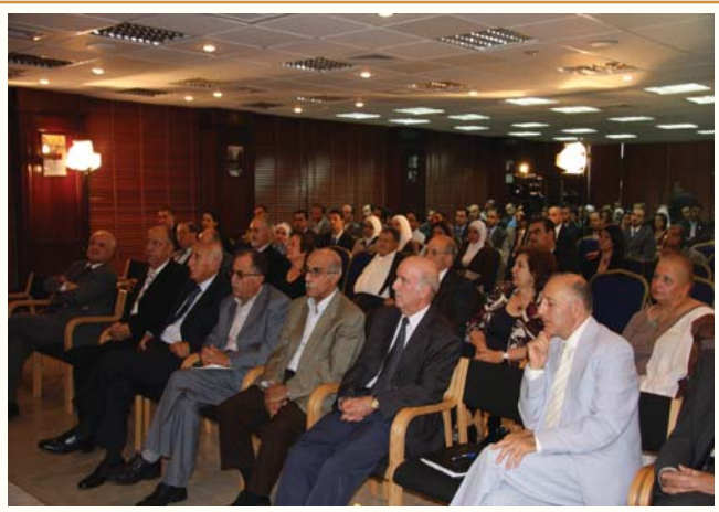
متابعة واهتمام من الحضور