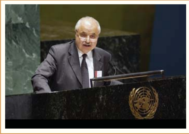
الاستاذ طلال أبوغزاله على منصة الامم المتحدة

نيويورك في ٢٥/٩/٢٠٠٨ - وقع رئيس مجموعة طلال أبوغزاله مع رؤساء ثلاثين شركة عالمية كبرى بيان مبادرة أمين عام الأمم المتحدة التي أطلقها المنتدى الاممي للقطاع الخاص لإقامة شراكة بين الأمم المتحدة ورؤساء شركات عالمية كبرى لمضافة وتنسيق الجهود مع كافة القطاعات في سياسات وبرامج استدامة وإدارة وسلامة واستخراج وحقية ومعالجة وحسن استخدام المياه.